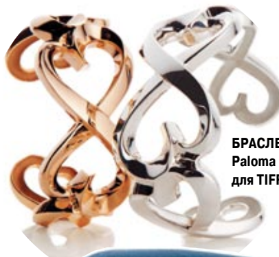
БРАСЛЕТЫ Paloma Picasso для TIFFANY & CO

Считаю недопустимым сочетание разных металлов. Не могу представить себе, как в одной мочке уха могут соседствовать золото, серебро или платина. Я считаю, что в украшениях всегда лучше меньше, да лучше. Может, это консервативно, но я также никогда не надену два кольца с разными камнями. Люблю прозрачные камни насыщенных цветов, такие как изумруд, сапфир, рубин, турмалин».